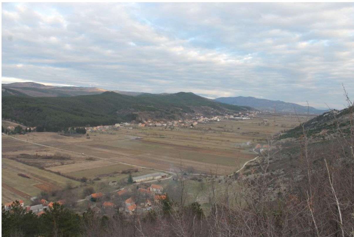
Pogled s gradine Kmeti na Mućko Polje