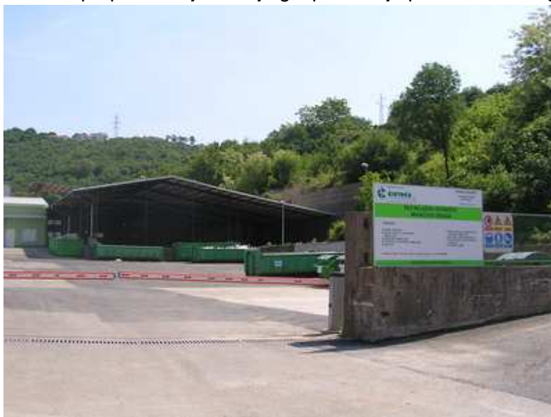
Slika 8.2.-1.: Primjer reciklažnog dvorišta