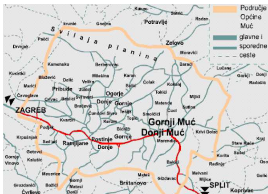
Slika 2.1.-1.: Geografski položaj Općine Muć

U odnosu na popis stanovništva iz 2001. godine, vidljiv je pad broja stanovništva u 2011.