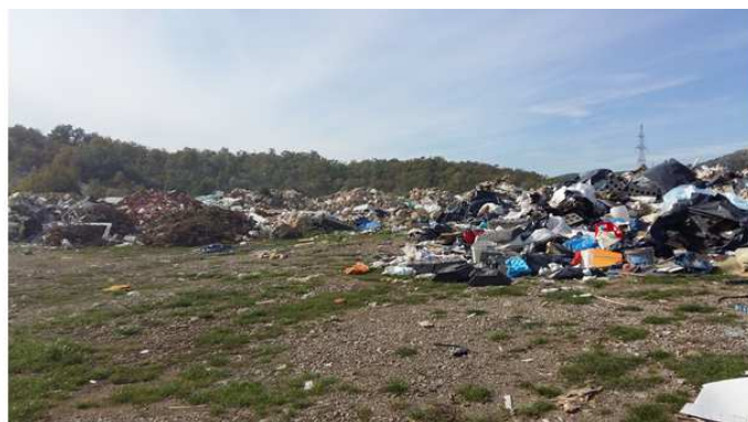
Slika 6.-1.: Lokacija Podine

Predviđeni su ukupni troškovi sanacije : 225.000,00 kn .