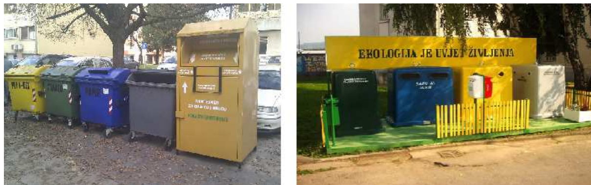
Slika 8.4.-1.: Primjeri zelenih otoka

Zeleni otok predstavlja skup spremnika za papir i karton, staklo, tekstil, plastičnu i metalnu ambalažu). Primjer zelenih otoka prikazan je na slici 8.4.-1.