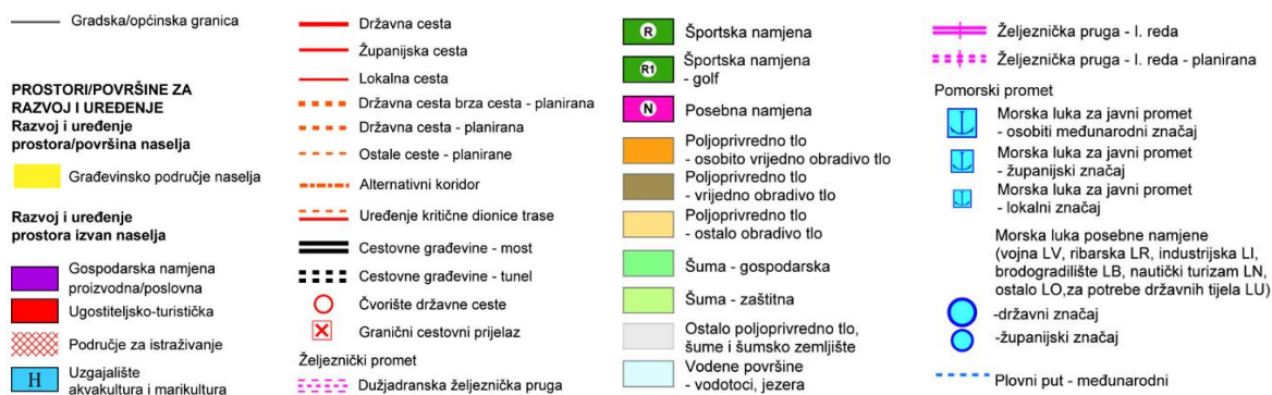
Slika 1. Prostorni plan Splitsko-dalmatinske županije – 1. Korištenje i namjena prostora